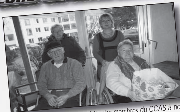
Mercredi 19 décembre, visite des membres du CCAS à nos aînés à l'hôpital où des colis ont été offerts par la municipalité.