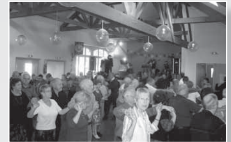
Photo du Fest-Deiz.