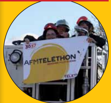
Même pas peur notre marraine !

Les sapeurs pompiers du Faouët Présence et conseils appréciés