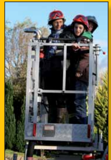
En toute sécurité avec les pompiers.