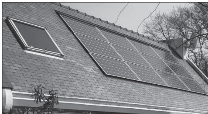
Panneaux photovoltaïques sur maison d'habitation.

Il constitue un cadre d'engagement pour le territoire. Il structure et rend visible l'action de la collectivité et des acteurs associés face au défi du changement climatique.