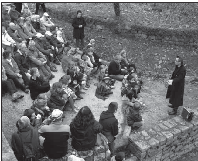
Sortie contes première étape du projet.

Le circuit de 3 kms est autour du bourg et passe par la zone humide derrière la mairie, une première tranche de nettoyage a été réalisée et se poursuivra avec l'aide du club de randonnée du Faouët. Les chantiers nature de Roi Morvan Communauté vont intervenir en janvier.