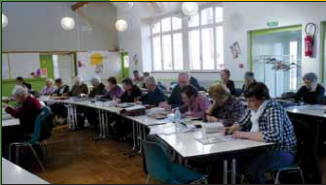
Jeu de lettres pour une après-midi bien sympathique.