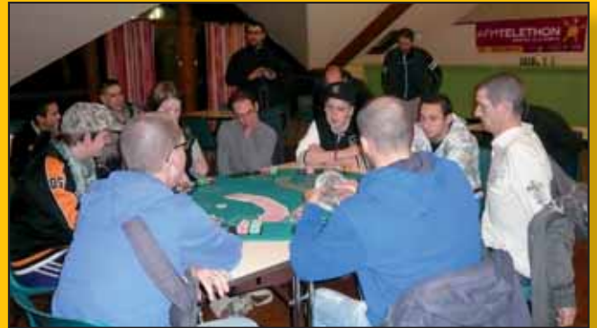
Sérieux le poker !