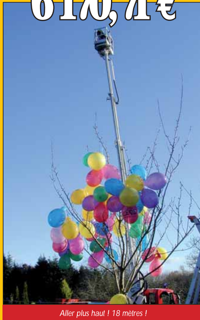
Aller plus haut ! 18 mètres !