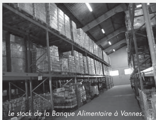
Le stock de la Banque Alimentaire à Vannes.