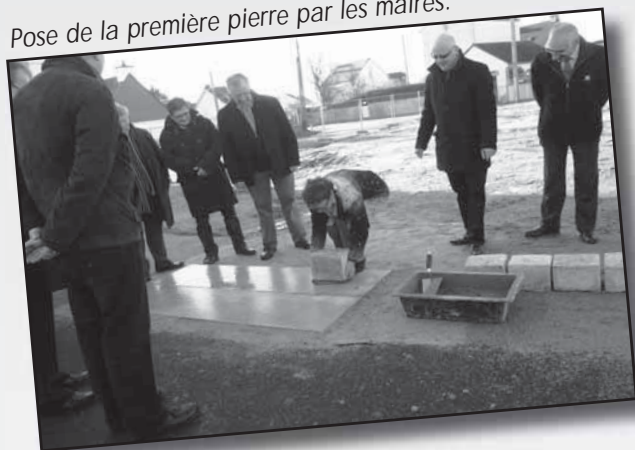
Pose de la première pierre par les maires.