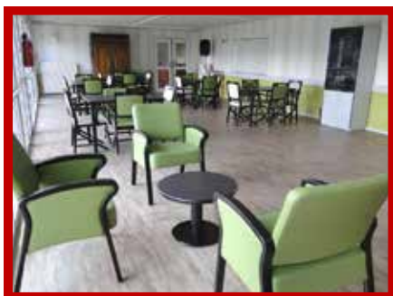
La salle d'animation