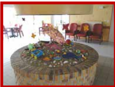
Le hall avec la cheminée