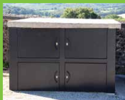
Le nouveau caveau provisoire réalisé par l'atelier PAGAN de Lanvéneq