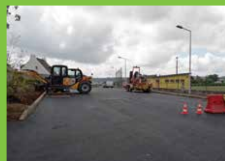
Enrobé rue du Stade