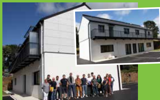
Maison de la Santé (réception avec les différents corps de métiers et le maître d'œuvre)

La rue du stade a déroulé son plus bel enrobé et les travaux de sécurisation de l'école se poursuivent.