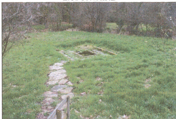
FONTAINE SUD de la chapelle découverte sous un roncier en 2009