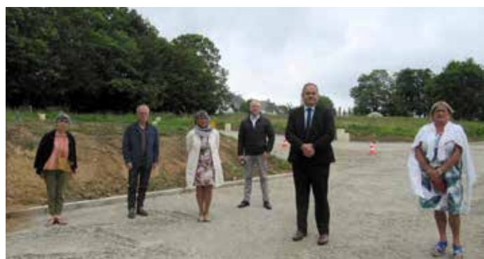
Visite du sous-préfet