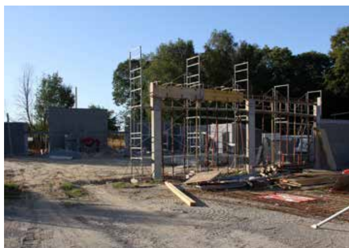
Espace Le Mestre