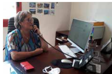
Mme le Maire

Le temps suspendu nous a appris à reconnaître l'essentiel, à redécouvrir nos commerces de proximité, à donner de l'importance à l'humain... alors n'oublions pas et restons surtout bien vigilant.