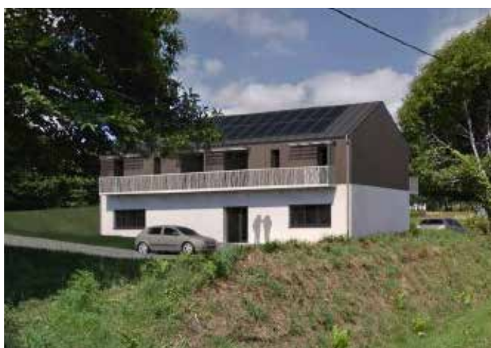
Maison médicale (photo d'illustration du projet)